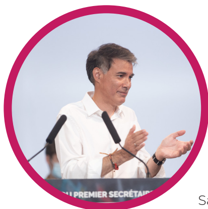
FAURE Olivier , Premier secrétaire du Parti Socialiste, Député de Seine-et-Marne